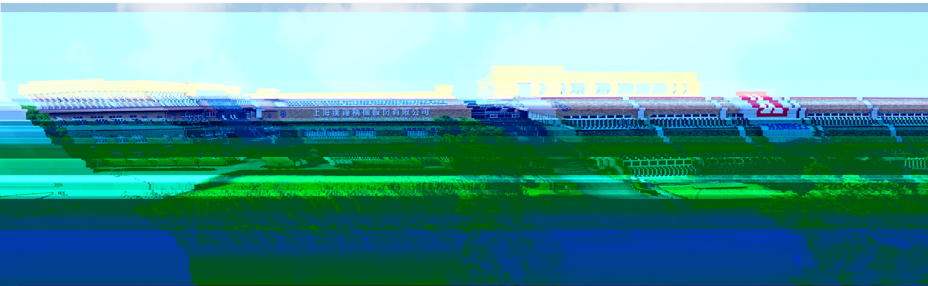
转子系统 汉钟优质 ARB 双螺杆空气压缩机主机 970 IES